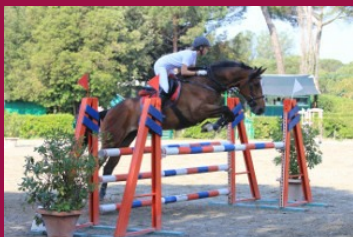
Castrone Belga in vendita