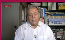
Condo: "Africa vince con suoi figli nelle nazionali eu..."