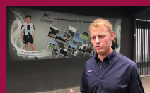
Alla scoperta di Ronaldo: il Nacional e lo stadio CR7