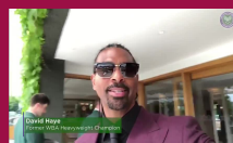
Gioca l'Inghilterra: l'in bocca al lupo arriva da Wimb...