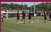
Roma scopre Kluivert, che punizione in allenamento!