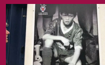
Alla scoperta di Ronaldo: Andorinha, il suo primo club