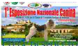
Spoleto: 1° Esposizione Nazionale Canina Città di Spoleto 2015