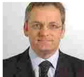
Toscana, Pedica: Gesto importante se governo visitasse zone alluvionate