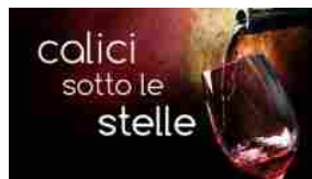
Cirella(CS): Sesta edizione della manifestazione "Calici Sotto le Stelle"