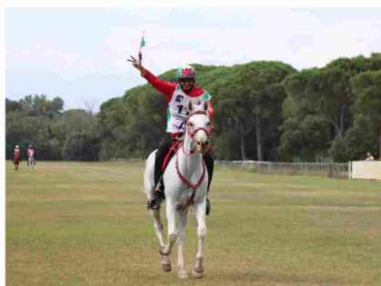
Il vincitore Sheikh Mohammed Bin Rashid Al Maktoum