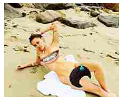
Le pazzie di Miley Cyrus, in vacanza al mare posa