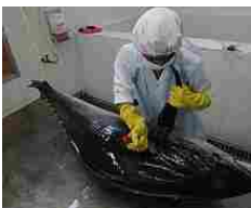
Bollito vivo a 270° nel tonno, condannata