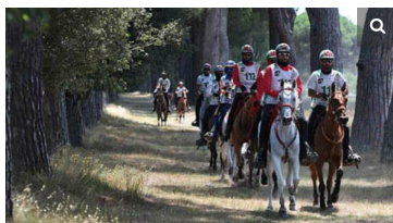
Toscana Endurance Lifestyle 2018: ecologia e benessere animale

Toscana Endurance Lifestyle edizione 2018 (24-27 luglio): diminuiscono le emissioni, aumentano i punti acqua. Parola d'ordine, rispetto per l'ecosistema e per il benessere animale