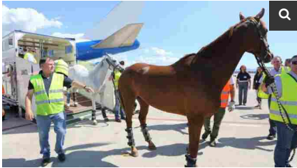
L'arrivo degli atleti a quattro gambe

La manifestazione fa base all'ippodromo di San Rossore