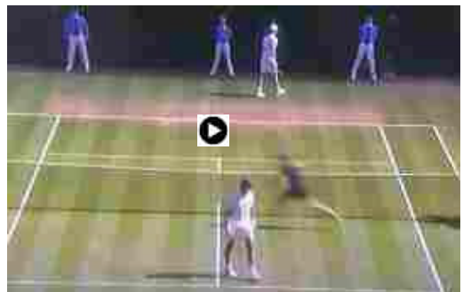
Irina Shayk e Bradley Cooper litigano a Wimbledon