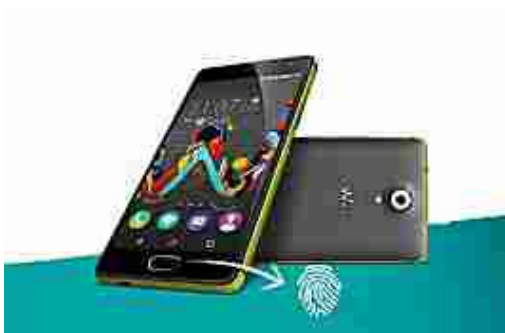
Letture impronte digitali, schermo HD e design innovativo. Scopri di più! (it.wikomobile.com)