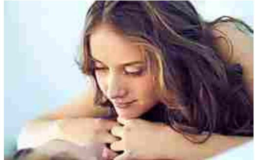
Il Galateo del Sesso (DonnaD)