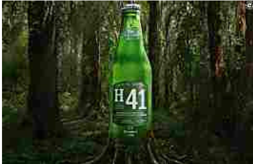
Tutto inizia da un lievito selvaggio: l'incredibile storia della H41 (Heineken.com)