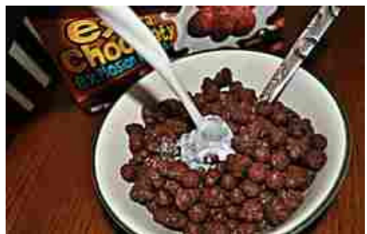
10 cibi calorici da evitare se vuoi dimagrire. Ecco gli alimenti che più fanno ingrassare (Hitparade)