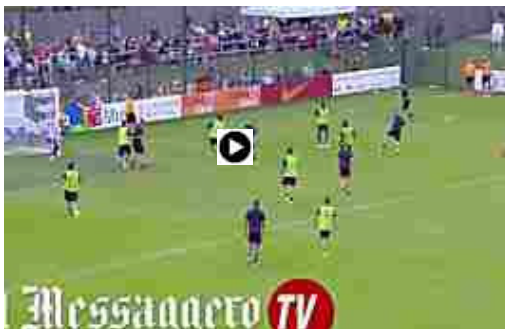
Roma, la giornata a Pinzolo: il videocommento di Alessandro Angeloni