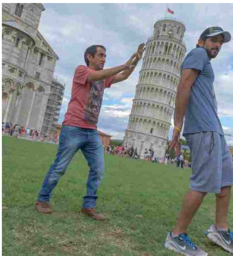
Il principe ereditario Hamdan bin Mohammed Al Maktoum "regge" la Torre "spinta" da un amico

Pisa. Alla fine non ha corso. Hanno speso milioni di euro, si sono costruiti una tenda da 1.500 metri quadrati al centro dell'ippodromo completa di suite e centro benessere, hanno prenotato almeno quattro hotel superlusso a Pisa, uno in