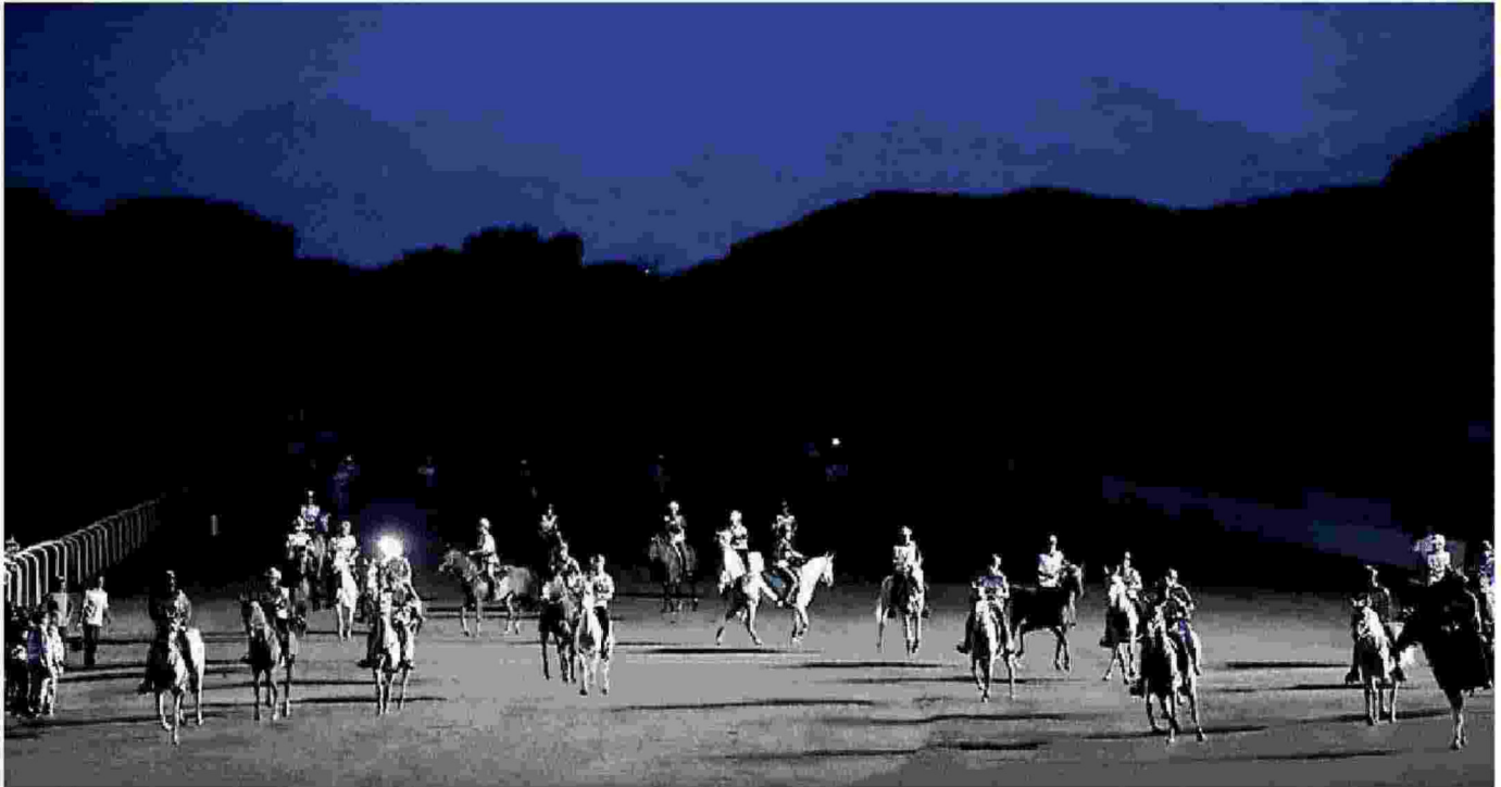
MAGIA Cavalli e cavalieri si preparano alla partenza della 160 chilometri mentre le Alpi Apuane fanno capolino sullo sfondo