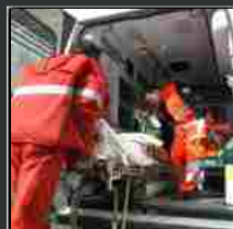
Calcinaia, scontro tra due auto: muore un anziano