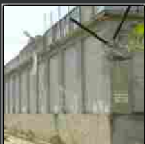
Carcere Don Bosco: giovane donna si toglie la vita impiccandosi