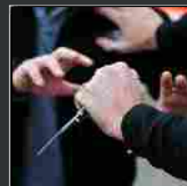
Impugna un coltello e minaccia di morte la vicina: denunciato