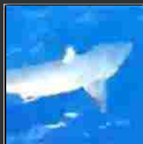
Marina di Pisa: catturato e liberato al largo della costa uno squalo Pinna Nera