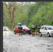
Maltempo, nubifragio in città: alberi caduti sulle auto in transito