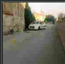
Navacchio, assalto e conflitto a fuoco alla sala Bingo: ucciso il rapinatore